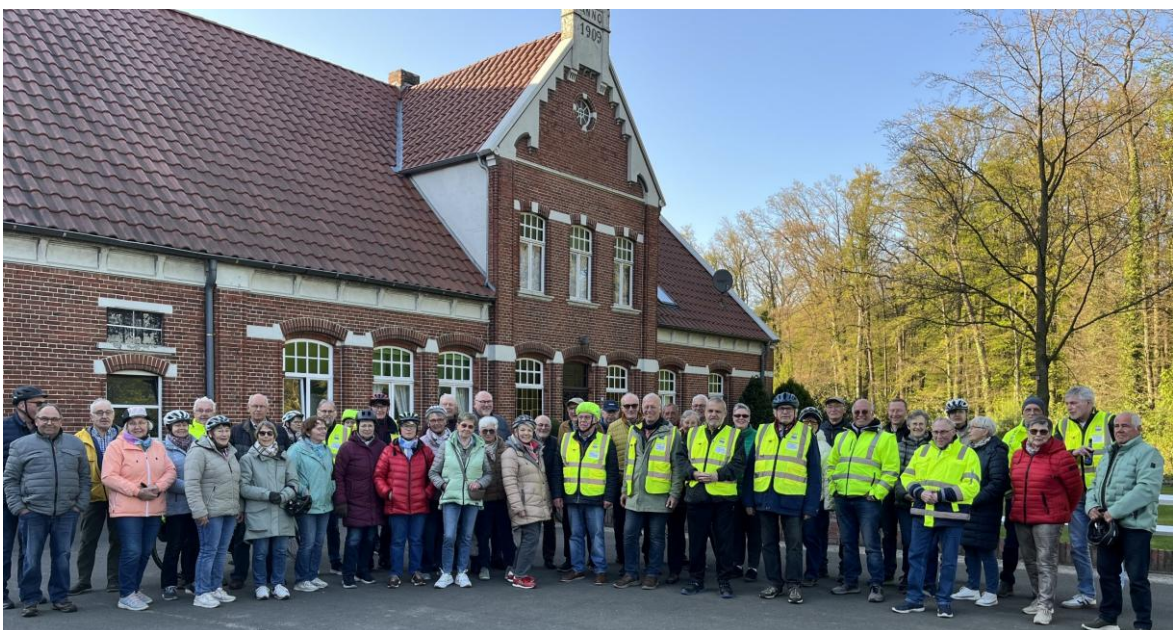
Gruppenbild vor dem Bauernhof Söbbing