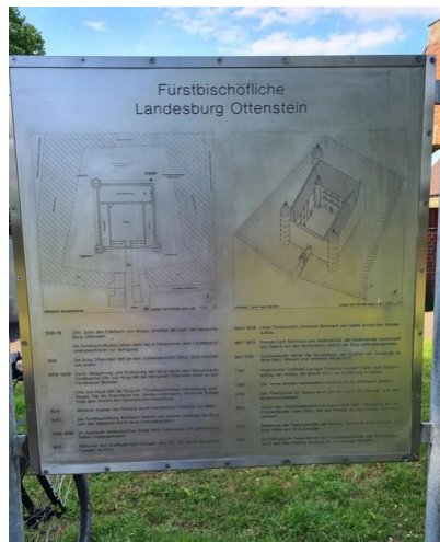
Fundamente, Denkmal und Infotafel zur Burg Ottenstein