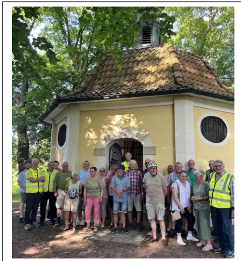
Vor der Kapelle Maria Brunn